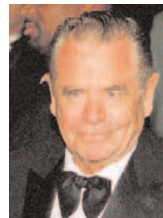
In den 50er Jahren beliebtester Leinwandheld: Glenn Ford.

An der Seite von Bette Davis und Rita Hayworth feierte er 1946 mit «Die grosse Lüge» und «Gilda» seine ersten grossen Leinwandfolgen. Ford war auch ein Frauenheld: Seiner grossen Liebe Maria Schell, mit der er 15 Jahre nach «Cimarron» (1961) noch «Superman» drehte, machte Ford mehrere vergebliche Anträge.