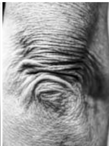
Vielfalt an den Bieler Fototagen: Beispiele aus den Projekten von Lolo Veloko, Reto Camenisch und Elisabeth Gochnahts (v.l.n.r.).